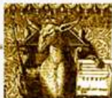
Noblesse & Excellence de l'Asne

Trins - St. Georg - Samstag 9.7.2022 - 19 Uhr