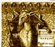
Noblesse & Excellence de l'Asne